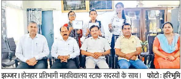
झज्जर। होनहार प्रतिभागी महाविद्यालय स्टाफ सदस्यों के साथ।