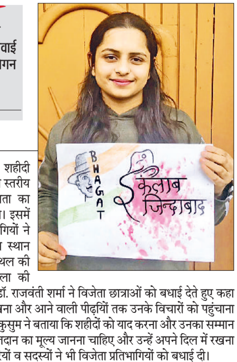
हरिभूमि न्यूज़ | बहादुरगढ़

वैश्य आर्य कन्या महाविद्यालय ने शहीदी दिवस के उपलक्ष्य में करवाई थी राज्य स्तरीय ऑनलाइन स्लोगन लेखन प्रतियोगिता, बुधवार को परिणाम किया जारी