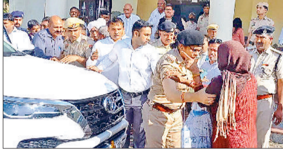
झज्जर। महिला को मंत्री की गाड़ी के आगे से हटाते हुए पुलिसकर्मी।