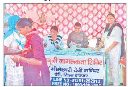
झज्जर। कानूनी जागरूकता स्टॉल पर उपस्थित पैरा लीगल वालंटियर।