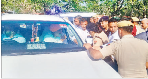
झज्जर। कैबिनेट मंत्री के समक्ष अपनी बात रखते हुए पीड़ित महिला।

लगाया कि वह पिछले 14 वर्षों से न्याय के लिए प्रशासन और पुलिस के चक्कर काट रही है, लेकिन उसकी कहीं सुनवाई नहीं हो रही। उसने पुलिस पर गंभीर आरोप लगाते हुए कहा कि शिकायत देने पर उसे ही धमकाकर वापस भेज दिया जाता है। वहीं, कैबिनेट मंत्री ने मामले की जांच करवाने और समस्या का जल्द समाधान करवाने का आश्वासन दिया।