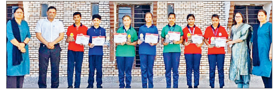
झज्जर। शिक्षकों के साथ मंच पर उपस्थित हिंदी व्याकरण प्रतियोगिता के विजेता विद्यार्थी।

इंडो-अमेरिकन स्कूल के विद्यार्थियों ने हाल ही में आयोजित हिंदी व्याकरण प्रतियोगिता में उत्कृष्ट प्रदर्शन करते हुए विद्यालय का नाम रोशन किया। विद्यालय निदेशक