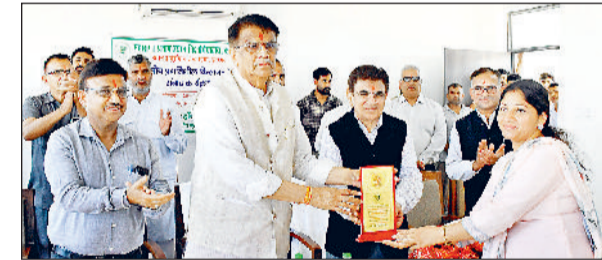
झज्जर। जागरूक किसानों को सम्मानित करते हुए भाजपा के राष्ट्रीय सचिव ओमप्रकाश धनखड़।