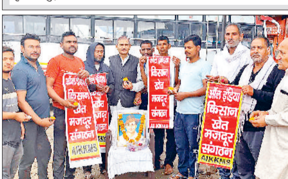
झज्जर। अमर शहीद भागत सिंह को श्रद्धांजलि देते हुए किसान व मजदूर।